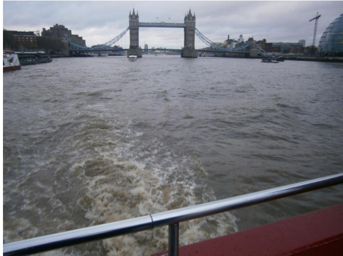
4 TÁMESIS NAVEGABLE: FOTO DESDE LA POPA DEL BARCO EN 2012, PUENTE LEVADIZO Y PASARELA PARA PEATONES