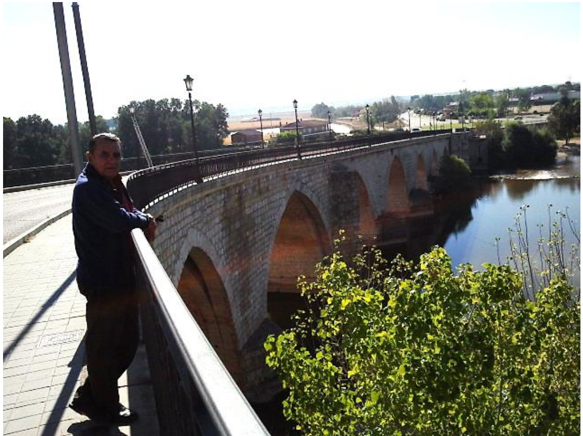
5VERANO 2012: RÍO DUERO EN TORDESILLAS, LUGAR DE CRUENTAS BATALLAS EN 1812 ENTRE FRANCESES E INGLESES Y ESPAÑOLES

las unidades y heroicos caídos de ambos bandos contendientes. En Potes (Asturias) contemplamos el espectacular terreno por el que se movían luchaban y morían los guerrilleros y su enlace a la meseta por el espectacular puerto de Piedrasluengas, rodeados de los agrestes Picos de Europa y de la mole solitaria de Peña Labra. Por último a fin de año pudimos visitar la grandiosa estatua que tiene en Londres Lord Wellington acompañado de sus guerreros y el monumental arco del triunfo en honor del general. Nos quedamos sin poder recorrer la mansión del lord al lado de tales monumentos pues la visita es los fines de semana. Eso puede ser una buena excusa para animarnos a repetir el vuelo a la maravillosa capital londinense a la primera ocasión. No deben olvidar aquellos que viajan mucho a América recordar que en sus puertos recalaban muchas naves que partían de Cádiz y que por allí se juro en muchos lugares la Pepa en 1812, como hemos transcrito en las líneas anteriores. Ese recuerdo debe ser un acicate para documentar sus experiencias turísticas: el saber no ocupa lugar.