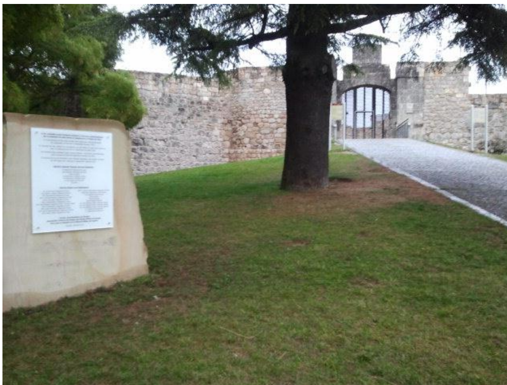
2 CASTILLO DE BURGOS: PLACA CONMEMORATIVA DE 1812 EN 2012

Entre las gacetas muy ilustrativas, después del vacío informativo propagandístico a que nos sometieron los meses anteriores (parecido a la reciente guerra de Libia contra Gadafi, que aún no sabemos lo que pasó), destacamos la del 22 de diciembre, núm. 245, en la que nos dan pormenores del asalto inglés al castillo de Burgos en octubre: ataque con minas y escalo de murallas; retirada hacia el Duero y voladuras de los puentes de Simancas y Tordesillas entre otros a finales de octubre. La 248, de 25 de diciembre destaca el carácter destructivo de los ingleses con la voladura de 15 puentes en su retirada de Burgos; y los del Tajo, incluido el puente de la Reina, en la retirada de Aranjuez; y la fábrica de loza de la China en el Retiro. La gaceta 253, de 30 de diciembre, hace un resumen desde Arapiles a su favor: “El lord Wellington venció en los Arapiles el día 22 de julio porque el general francés no esperó al Rey”; posteriormente, el monarca cruzó el Tajo el 14 de agosto y se dirigió hacia Almansa en busca de los ejércitos del mediodía y Aragón y regresa a Madrid con ellos el 3 de noviembre en persecución de los aliados que terminan retirándose a Portugal. Concluye con una andanada contra las cortes reunidas en Cádiz: “En España no hay cortes. El pueblo español no ha nombrado ni reconoce por sus representantes a los facciosos de Cádiz”. O sea, “la Pepa” era motivo de controversia.