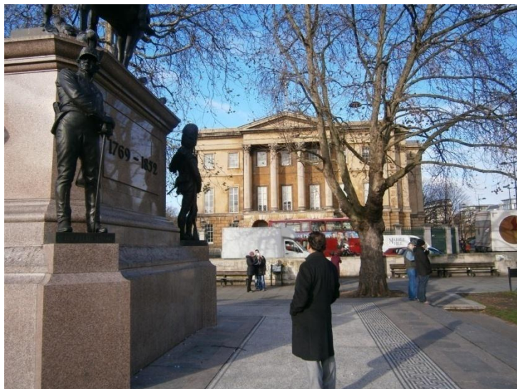
LONDRES: CASA MUSEO DE WELLINGTON, 2012